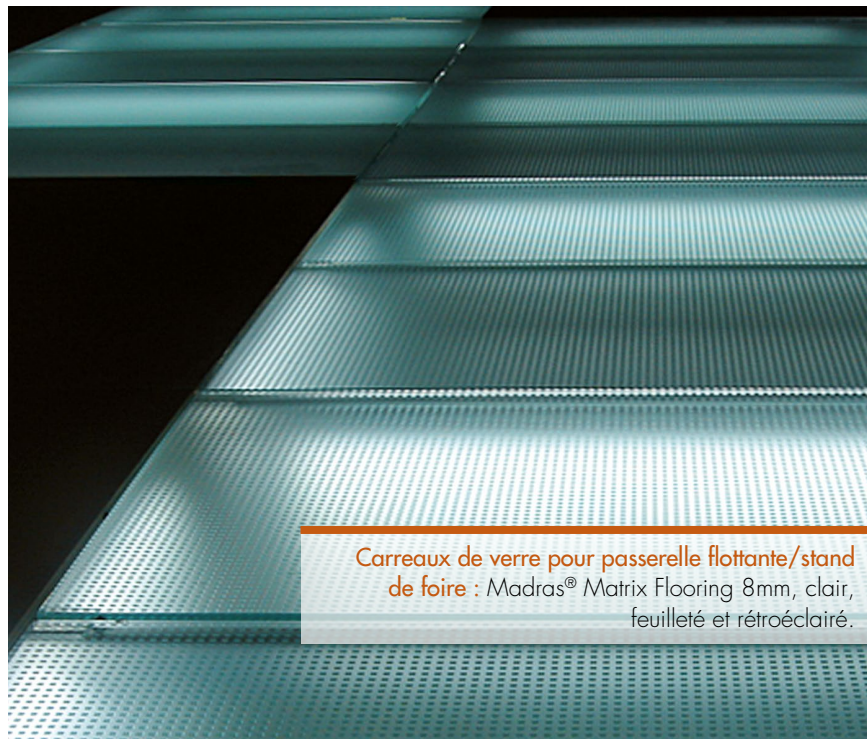
Carreaux de verre pour passerelle flottante/stand de foire : Madras® Matrix Flooring 8mm, clair, feuilleté et rétroéclairé.